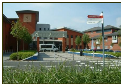
Wythenshawe Hospital no sul de Manchester

Nas próximas semanas novos trabalhos estarão sendo implantados em cidades onde há grande quantidade de pessoas que precisam ouvir as boas novas do evangelho de Cristo.